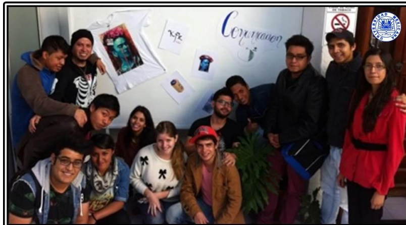
Licenciatura en Comunicación . Generación 2013-2016. Plantel Satélite. (2014)

La apreciación de una mente en desarrollo y el saberse partícipe, aunque sea en una mínima fracción, de la increíble metamorfosis producida dentro de la psique en ciernes de un joven que apenas va despertando, y que abre sus ojos para darse la oportunidad de ver su entorno con una visión distinta, y abre su mente para razonar sobre el confín del universo con un pensamiento distinto, y abre su espíritu para sentir las diversas energías con una sensación distinta. Es indescriptible.